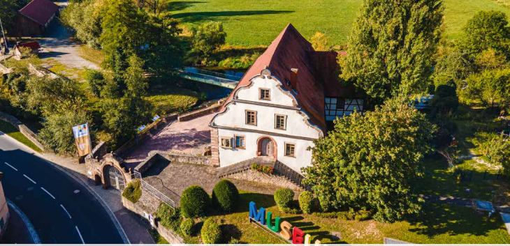
Hammelburg Museum Herrenmühle